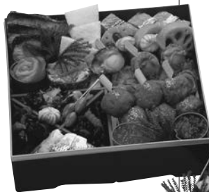
※写真のおせち料理は“舞”です。