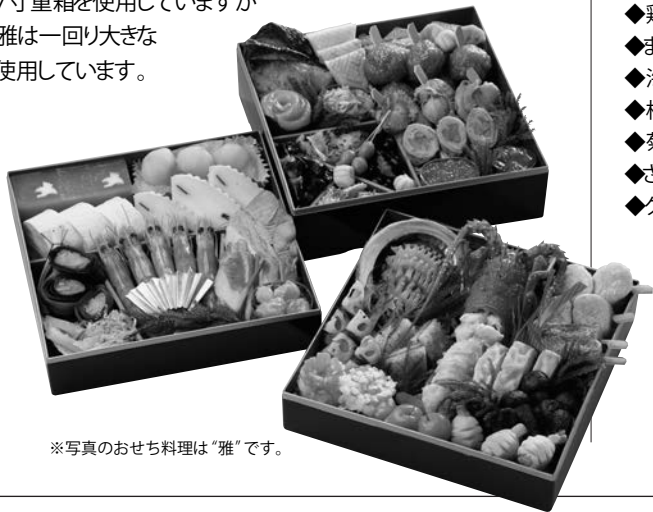
※写真のおせち料理は“雅”です。

百貨店などでいろいろな料亭のおせち料理が パンフレットで紹介されていますが大きさは実感できないものです。 通常は6〜7寸重箱を使用していますが 当社の舞、雅は一回り大きな 8寸重箱を使用しています。