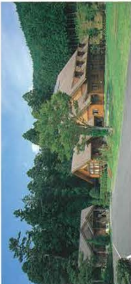
中川根ウッドハウスおろくぼ

マヨウツツジの俗称で老木の樹皮がマノの肌によく似ていることから一名マツバハダといわれています。5月下旬から6月上旬にかけて山犬段周辺特に蕎麦粒山(標高1,627m)の頂上付近から高塚山(標高1,621m)周辺にかけて白く可憐な花を咲かせます。