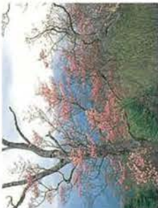
シロヤシオ(ツツジ科)

茶と緑と心とフォールなかわね茶茗館は、中川根の里の暮らし、自然・産物など、お茶をキーワードに紹介する新しいコミュニティエリアです。川根茶のふるさと中川根の心と味をたっぷりと満喫して下さい。