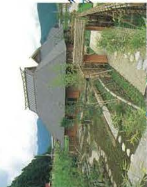
フオーレなかかわね茶茗館

茶と緑と心とフォールなかわね茶茗館は、中川根の里の暮らし、自然・産物など、お茶をキーワードに紹介する新しいコミュニティエリアです。川根茶のふるさと中川根の心と味をたっぷりと満喫して下さい。